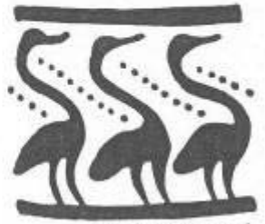
τὰ ἐξάρα πηνά'