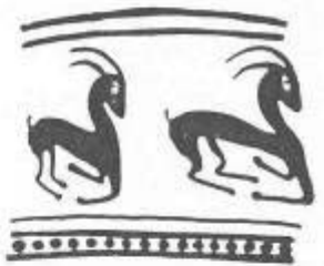
τὸ ὄφραξιννο ἄσπιδος τῶ βροσίου