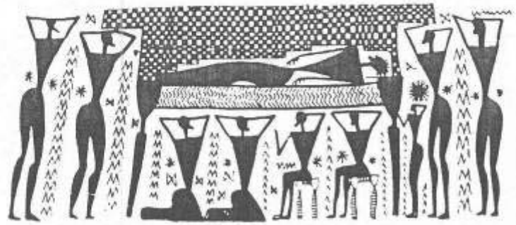
Ἡ πρόθεσι τοῦ νεκροῦ

Πρώτην Γεωμ. περίοδο 900-850 π.Χ. Ψευδή Γεωμ. περίοδος 850-760 " Υστερή Γεωμ. περίοδος 760-700 "