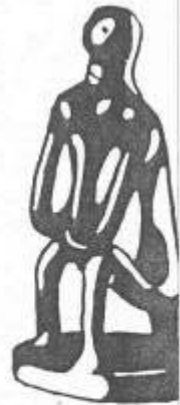
ὁ βυσιτόμας τῶ βροσίου