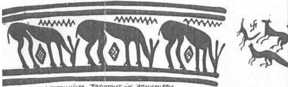
βιημάτοποιημένες παροτακτικές ἀπεικονίσεις