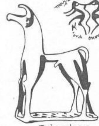
πορτὰ ποῦ διακρίκων