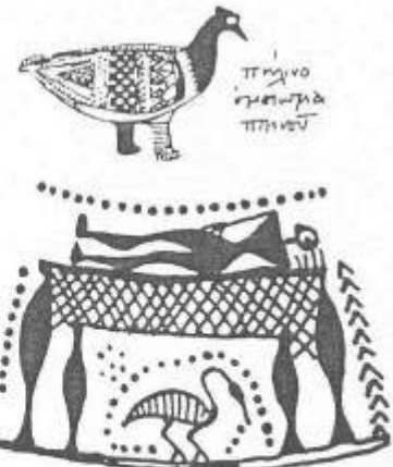
πτηνὸ γλυπτικὸ πτηνίου