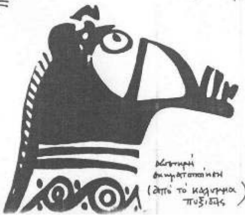
Καταμήν βιημάτοποιημένη (ἀπὸ τὸ καθήκον πύξιδος)